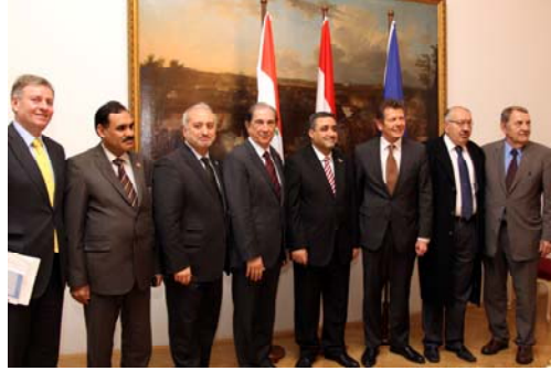
وزير الدولة النمساوي للشؤون الخارجية فولفجانج فالدنر يرحب بالوفد العراقي وممثلي الغرفة

وفي جلسة احتفالية، وبحضور الدكتور ريتشارد شينتس رئيس الغرفة، والمستشار نبيل الكزبري، الرئيس العربي للغرفة، وممثلين عن مجلس الشيوخ النمساوي والبرلمان المحلي لمحافظة فيينا، ورئيس قسم الشرق الأوسط وأفريقيا في وزارة الخارجية النمساوية، الدكتور فريدريش شتيفت، وسعادة السفير العراقي لدى النمسا الدكتور سرود نجيب، تم توقيع مذكرة تفاهم بين محافظة بغداد وغرفة التجارة العربية النمساوية تهدف إلى إيجاد صيغ للتعاون المشترك بين الجانبين العراقي والنمسا في مجال نقل التكنولوجيا واستخدامات الطاقة البديلة، وذلك من خلال تشكيل مجموعة عمل استشارية اقتصادية تكون من المحافظة والغرفة.