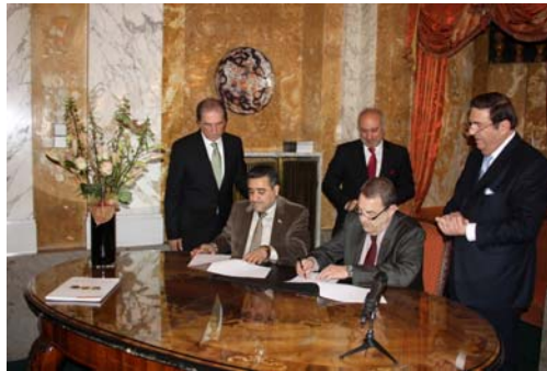
الدكتور ريتشارد شينتس والمستشار نبيل الكزبري يوقعان مذكرة التفاهم مع الدكتور صلاح عبد الرزاق

وفي جلسة احتفالية، وبحضور الدكتور ريتشارد شينتس رئيس الغرفة، والمستشار نبيل الكزبري، الرئيس العربي للغرفة، وممثلين عن مجلس الشيوخ النمساوي والبرلمان المحلي لمحافظة فيينا، ورئيس قسم الشرق الأوسط وأفريقيا في وزارة الخارجية النمساوية، الدكتور فريدريش شتيفت، وسعادة السفير العراقي لدى النمسا الدكتور سرود نجيب، تم توقيع مذكرة تفاهم بين محافظة بغداد وغرفة التجارة العربية النمساوية تهدف إلى إيجاد صيغ للتعاون المشترك بين الجانبين العراقي والنمسا في مجال نقل التكنولوجيا واستخدامات الطاقة البديلة، وذلك من خلال تشكيل مجموعة عمل استشارية اقتصادية تكون من المحافظة والغرفة.