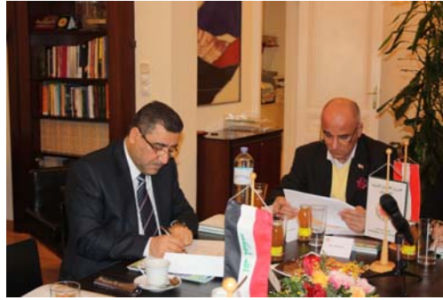
محافظ بغداد، الدكتور صلاح عبد الرزاق (يسارا) في مستهل زيارته للنمسا

استقبلت غرفة التجارة العربية النمساوية وفدا عراقيا رفيع المستوى، برئاسة محافظ بغداد الدكتور صلاح عبد الرزاق، الذي حل على النمسا في زيارة دامت أربعة أيام، التقى خلالها عددا من المسؤولين النمساوية، بالإضافة إلى زيارات ميدانية لعدد من المنشآت المتخصصة في الطاقة البديلة، وإعادة تدوير النفايات. ووقع المحافظ مذكرة تفاهم بين بغداد والغرفة بغرض إيجاد صيغ للتعاون المشترك بين الجانبين العراقي والنمسا في مجال نقل التكنولوجيا واستخدامات الطاقة البديلة.