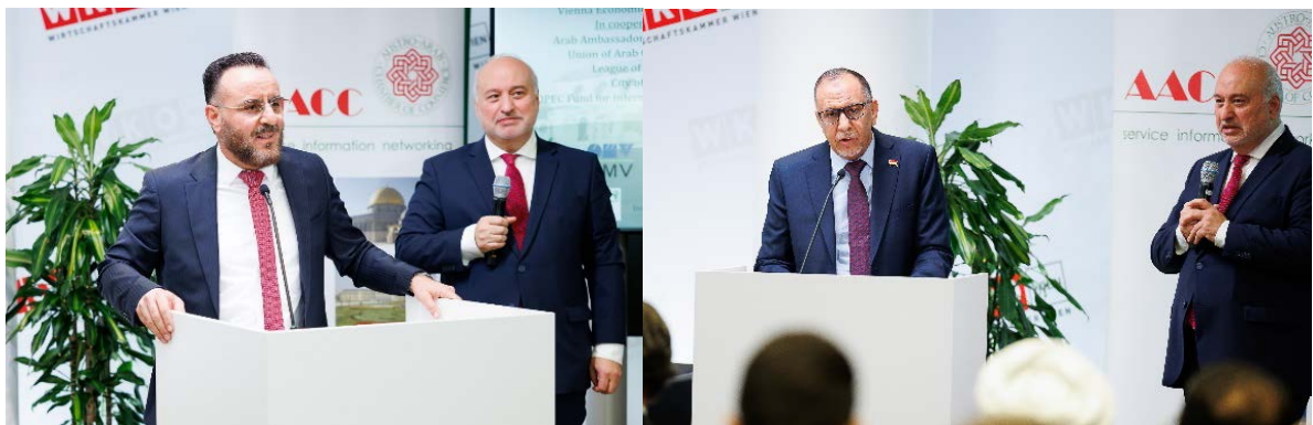
Ansprachen der Industrieminister von Libyen (links) und Jemen (rechts)

Als besondere Ehrengäste nahmen der libysche Minister für Industrie & Mineralien S.E. Ahmed Abu Hisa , der jemenitische Minister für Industrie & Handel S.E. Mohammed Al-Ashwal , der libanesische Minister für Industrie S.E. George Bouchikian , sowie zahlreiche weitere Delegierte aus Libyen, Saudi-Arabien, Algerien, Jordanien, Syrien, Kuwait, Griechenland, Deutschland, Chile, Slowakei, Ungarn, Österreich und andere Ländern teil.