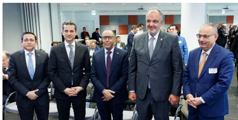
von links: Jemenitischer Botschafter S.E. Haitham Shoja'adin - Libanesischer Botschafter S.E. Ibrahim Assaf - Minister Al-Ashwal, Jemen; Minister Bouchikian, Libanon; Botschafter Abdulaziz Almikhlafi, Generalsekretär Ghorfa