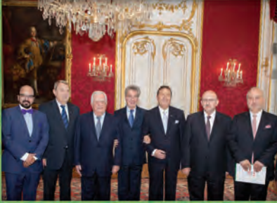
رئيس النمسا في أحد لقاءاته مع رئاسة الغرفة وضيوفها - قصر الرئاسة النمساوية ٢٠١٢

تمارس غرفة التجارة العربية النمساوية نشاطاتها منذ عام ١٩٨٩ تحت مظلة جامعة الدول العربية والاتحاد العام لغرف التجارة والصناعة والزراعة للبلاد العربية . وتهدف إلى دعم التعاون الاقتصادي والتبادل الثقافي والتجاري بين النمسا والدول العربية ، ونقل التكنولوجيا النمساوية إلى الوطن العربي