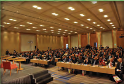
من فعاليات الغرفة: المؤتمر الدولي حول آفاق التعاون بين السودان وأوروبا - أكتوبر ٢٠١٢

العنوان: Lobkowitzplatz 1/15. 1010 Vienna. Austria