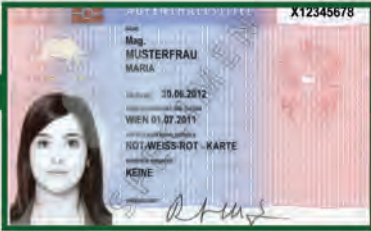
نموذج لتصريح الإقامة بالنمسا

هناك قسمان من تصاريح الدخول أو الإقامة بالنمسا، الأول وهو تأشيرات الإقامة لمدة زمنية قصيرة، وتصاريح الإقامة لمدة زمنية طويلة .